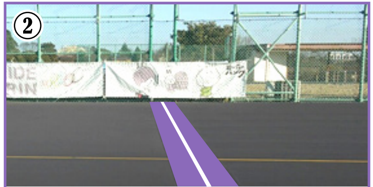
② スタート・ゴール地点。