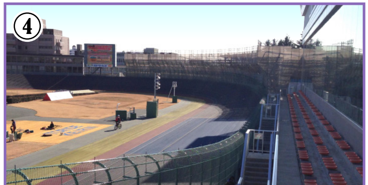
④ 直進はスピード勝負。