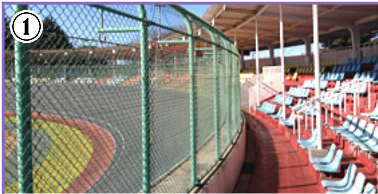
① 選手待機所。観戦もできます。