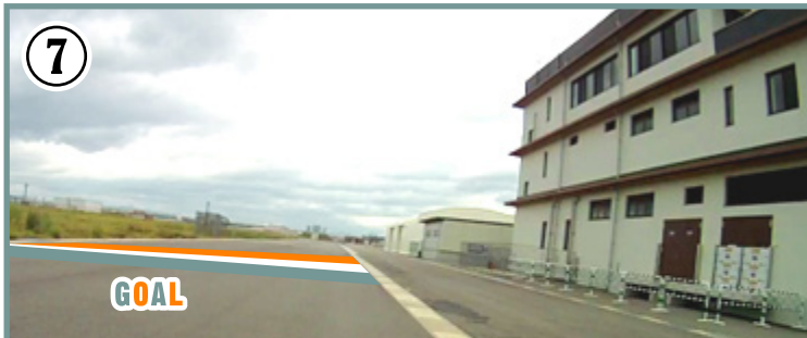
⑦ ゴール地点。 ゴール後コースは緩やかに左へ曲がっています。気を抜かずしっかりと前を見て走りましょう。