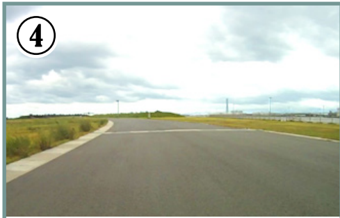
④ スタート地点から300m。緩やかな左コーナー。コーナーは緩いのでペダルを漕ぎながらでもOK。次のコーナーは左へ鋭角に曲がるので、走行ラインを徐々に右側へ。