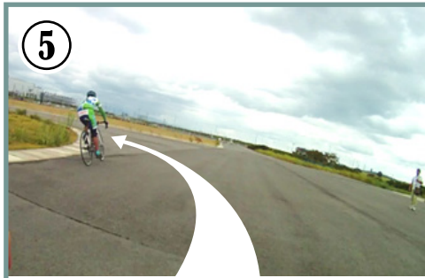
⑤ 左鋭角コーナー。コーナー手前で減速を終わってから自転車を倒し込みましょう。