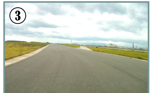
③ 第1コーナーを立ち上がると200mの直線。