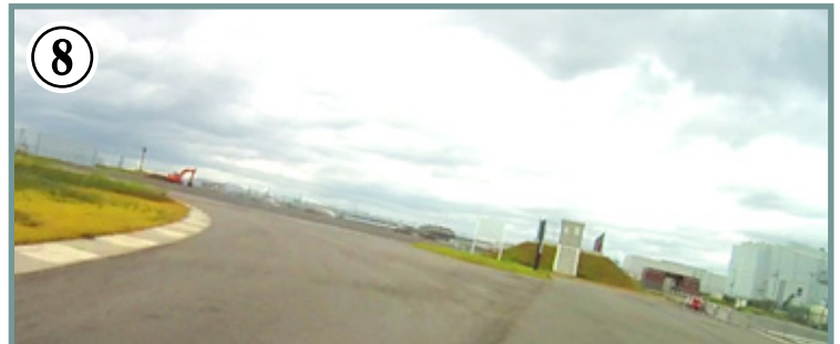
⑧ 左高速コーナー。ペダルと地面の接触に注意。