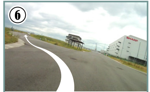
⑥ ゴールまで200m地点。ラスト周回のゴールスプリントはS字コーナーを曲がりながらになります。左右に気を付け、走行ラインを守ってスプリントを行いましょう。