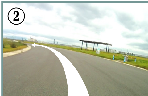
② 第1コーナー。 ペースが速い時は自転車が大きく左に倒れ込みます。ペダルが地面と接触しないよう注意!