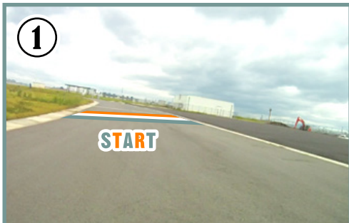
① 道幅十分なスタート地点(左回りで周回)。