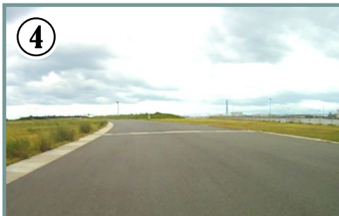
④ スタート地点から300m。緩やかな左コーナー。コーナーは緩いのでペダルを漕ぎながらでもOK。次のコーナーは左へ鋭角に曲がるので、走行ラインを徐々に右側へ。