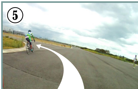
⑤ 左鋭角コーナー。コーナー手前で減速を終わってから自転車を倒し込みましょう。