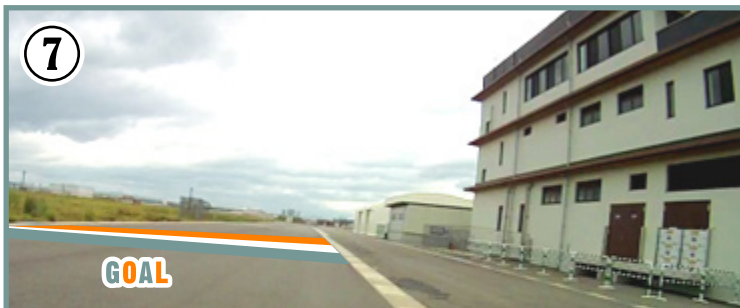
⑦ ゴール地点。 ゴール後コースは緩やかに左へ曲がっています。気を抜かずしっかりと前を見て走りましょう。