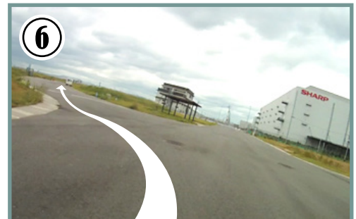
⑥ ゴールまで200m地点。ラスト周回のゴールスプリントはS字コーナーを曲がりながらになります。左右に気を付け、走行ラインを守ってスプリントを行きましょう。